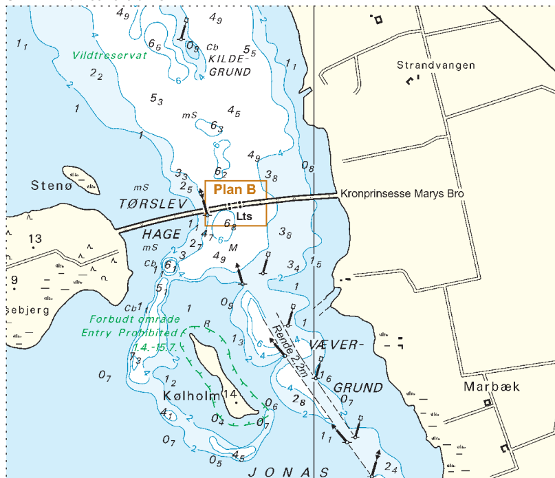
Søkortrettelser / Chart Corrections 34/470 2019