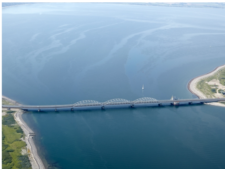
Set fra N - fotograferet august 2016