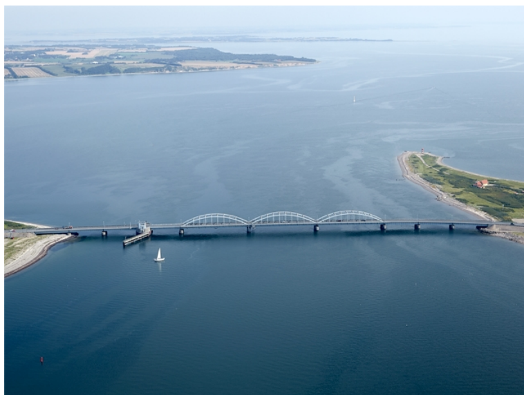
Set fra S - fotograferet august 2016

Overtrædelse af disse bestemmelser straffes med bøde.