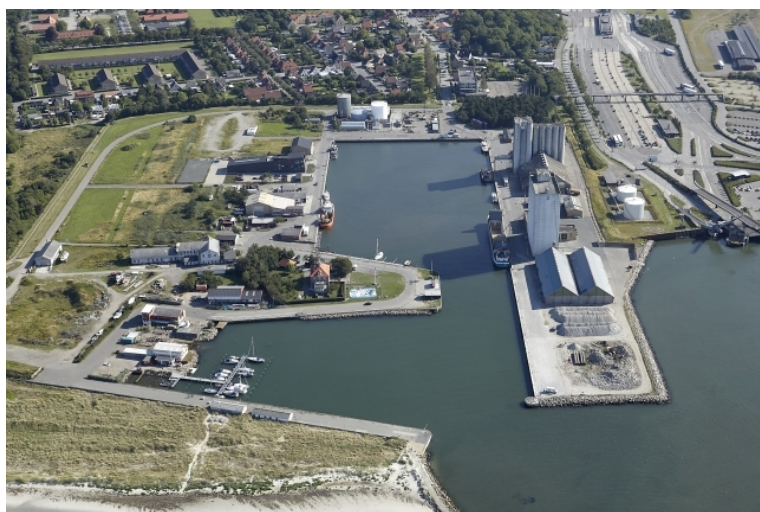
Vestre Havn og Nordre Havn - fotograferet august 2015