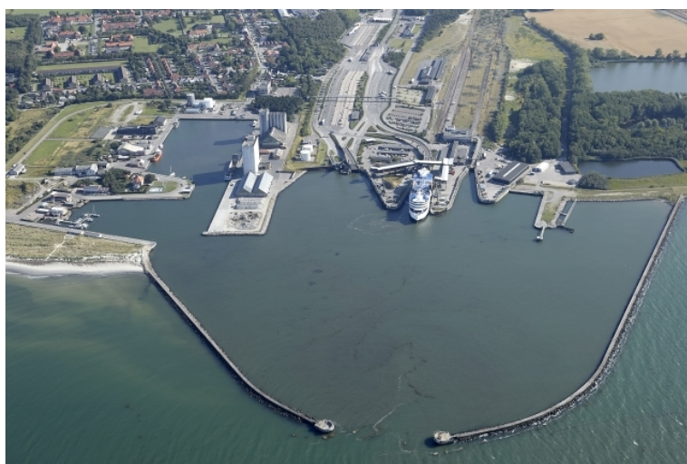
Færgehavnen - fotograferet august 2015