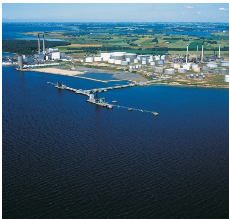
fotograferet august 1999

Smålandsfarvandet, Agersø Sund 55°12,0'N 011°15,4'E - kort 143