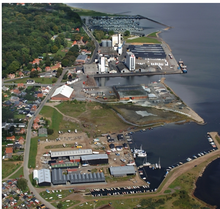
fotograferet juli 2010